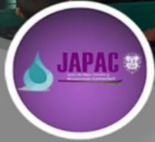
Platica Escuela Manuela Taboada Comonfort